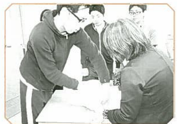
オムツ当て方練習中

▼質問② 入社前、介護職に対してどうイメージをしていたか 多数回答↓辛くキツイ・高年齢が好きで人生にかかわる 少数回答↓笑顔が大事・閉鎖的で機械的