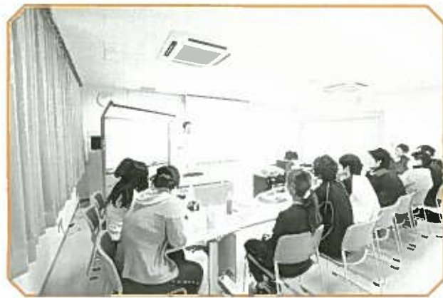
講義は集中が大事！

▼質問⑥ 菊華園に望むこと 多数回答↓職員、利用者共に笑顔になる環境 少数回答↓仕事がしやすい環境、パイオニア