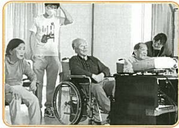
時折職員と話しながらスライドショーを楽しむ入居者

保育園のお遊戯会の様子を収めた写真が投影されました。それまではどこことなく「これから何が始まるんだ?」という表情だった入居者も、可愛らしい園児たちと彼らを暖かく見守る入居者の写真を見ることが自然と相好を崩しします。