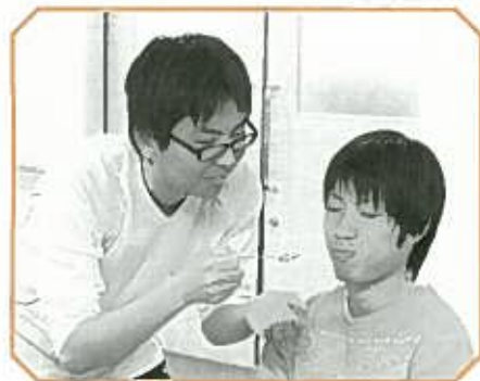
「口開けて下さーい」

▼質問④ あなたの将来の目標、夢は 多数回答↓仕事関連 少数回答↓親孝行 ▼質問⑤ 五年後の自分はどうなっているか 多数回答↓結婚 少数回答↓祝四十歳