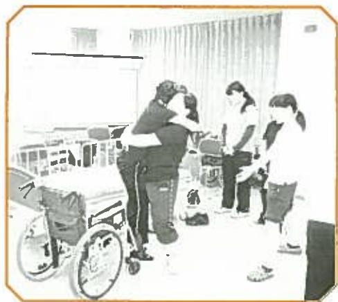
ベッドから車イスへ

▼質問⑦ どんな施設を目指していきたいか 多数回答↓笑顔が絶えない 少数回答↓心からの介護ができる 職場・施設として良